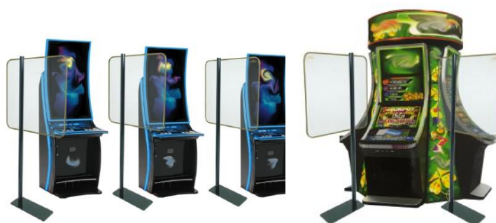
Per Slot Machine