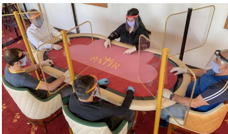
Per Giochi da Tavolo