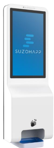
Montato a parete