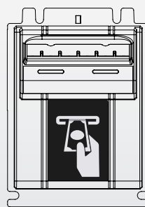
410169 Orientación hacia abajo