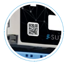
Código QR para conexión inalámbrica local