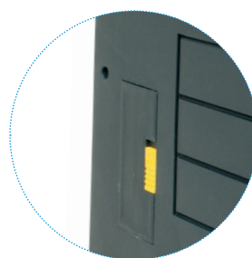
Датчик выдачи монет легко доступен для технического обслуживания