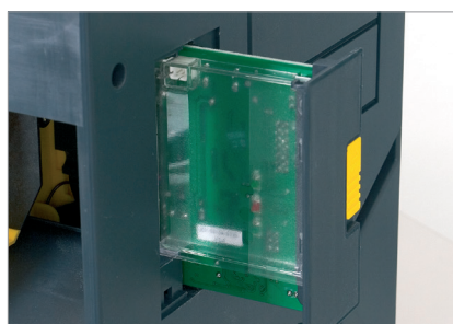
Tarjeta de fácil extracción desde el exterior